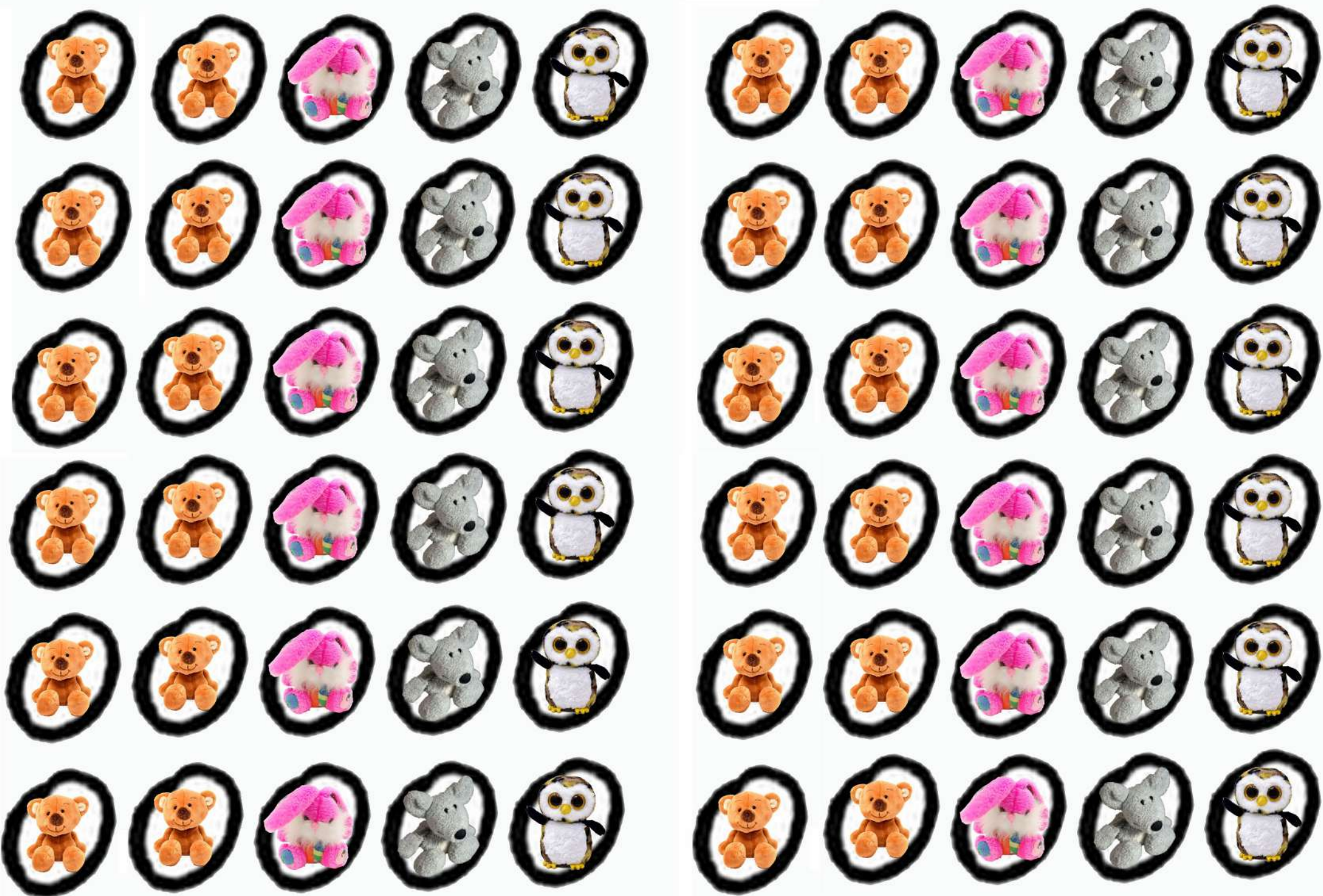
Doudous à découper