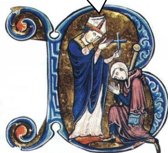
L'évêque bénit un pèlerin. (Enluminure, fin du XIII e siècle, bibliothèque municipale de Besançon.)

« Au sol nous avons conçu, pour le pénitent, un chemin vers le Salut » »